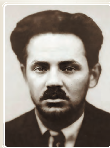
ВОЛКОВ Григорій Іванович 1890 р. (за іншими даними 1892 р.) — 8 лютого 1938 р.

Крім зазначених вище дисертацій, найважливішими його працями були наступні: «Учение об уголовных доказательствах» (кн. 1, 1882; кн. 2, 1883); «Защитительные речи и публичные лекции» (1892); «Учебник русского уголовного права. Общая часть» (1889); «Уголовный законодатель как воспитатель народа» (1903); «Курс уголовного права. Основы нынешнего уголовного права» (ч. 1, 1908).