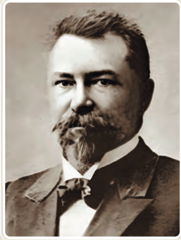
АЛЕКСЕЄНКО Михайло Мартинович 5 жовтня 1848 р. — 1917 р.