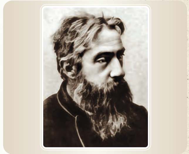
ГАТТЕНБЕРГЕР Костянтин Костянтинович 1844 р. — 8 травня 1893 р.

У 1930 р. ним видано «Навчальний курс кримінального права», де докладно проаналізовано проблеми кримінального права, що стосуються злочину. Це видання становить інтерес і для сьогоденного читача, дає уявлення про рівень розвитку науки кримінального права на зламі 30-х рр.